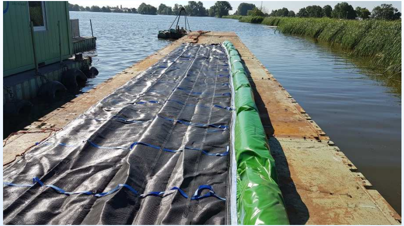
In hoogte instelbaar luwtescherm, project Langeraar