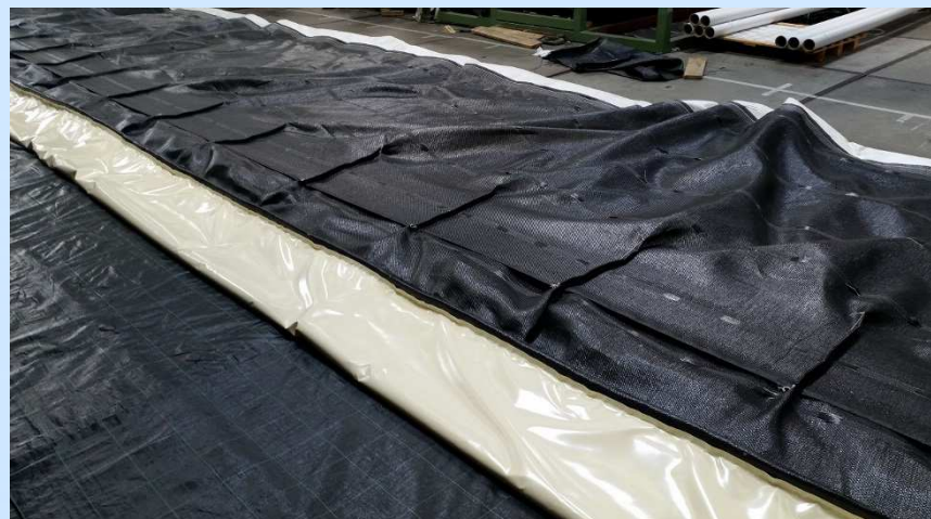
Slibscherm Kinderdijk, verzwaringpockets

Zo hebben wij slibschermen vervaardigd met speciale vulpockets om het scherm naar behoefte vanaf de bovenzijde te kunnen verzwaren.